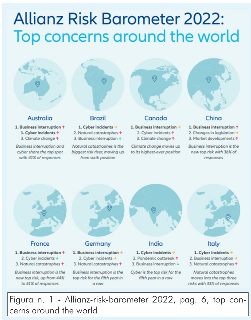
Figura n. 1 - Allianz-risk-barometer 2022, pag. 6, top concerns around the world

Le interconnessioni forti e continue che caratterizzano certe filiere produttive potrebbero, infatti, configurare un contesto di caduta simultanea di intere supply chain per la mancanza di prodotto a monte. Questo effetto si tradurrebbe, poi a valle nell'impossibilità di evadere ordini in settori anche ad alto valore aggiunto, con l'inevitabile riflesso in termini occupazionali e di potenza industriale di un paese o territorio. Si evidenzia, infatti, come il 45% degli intervistati di AGCS evidenzi che la supply chain disruption abbia avuto un impatto molto